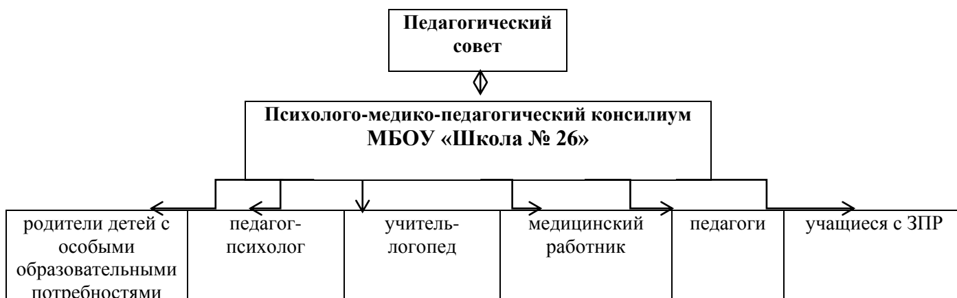
Схема внутреннего механизма взаимодействия

Одним из основных механизмов реализации коррекционной работы является оптимально выстроенное взаимодействие специалистов образовательного учреждения , обеспечивающее системное сопровождение детей с ограниченными возможностями здоровья специалистами различного профиля в образовательном процессе.